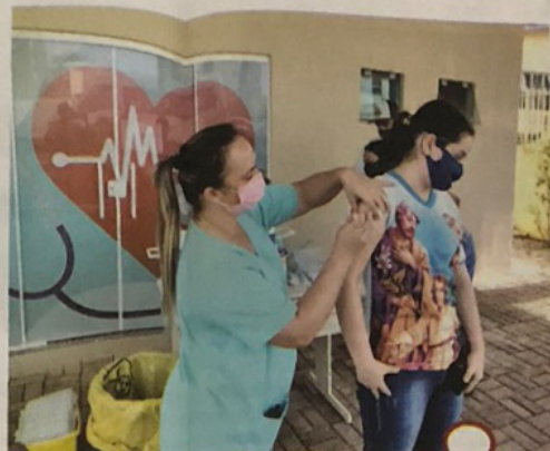
Vacinação contra a gripe H1N1 atinge todas as idades em Novo Itacolomi

"Nós entendemos que prevenir é o melhor remédio, por isso estamos investindo na vacinação de toda a população contra a gripe H1N1,